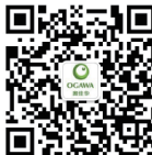
奥佳华官方微信二维码